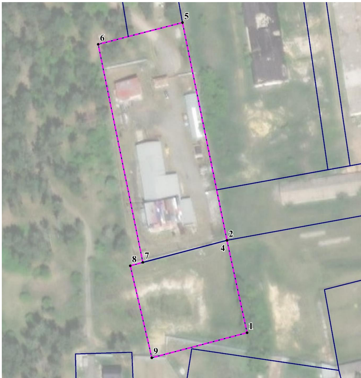
Таблица № 5

Каталог координат поворотных точек границ территории, в отношении которой утвержден проект межевания